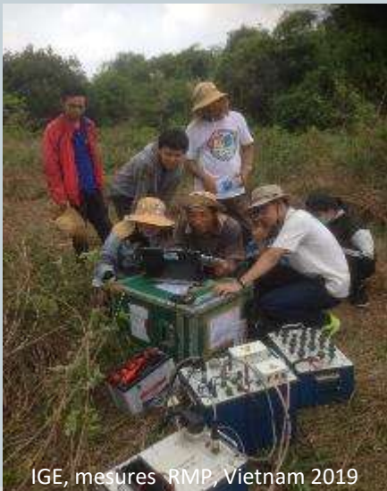
Ige, mesures RMP, Vietnam 2019

La cartographie du sol a connu d'importantes avancées depuis ses débuts il y a plus d'un siècle. La cartographie numérique des sols (DSM, Digital Soil Mapping), correspond à des techniques numériques qui visent à prédire des classes de sol ou des propriétés de sol. Elle utilise, d'une part, des données pédologiques et d'autre part, des données spatiales appelées covariables. On trouve parmi ces covariables des données issues de prospections géophysiques. Lors de GEOFCAN 2020, nous souhaitons pouvoir présenter des études récentes dans ce domaine.