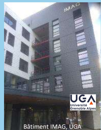
Bâtiment IMAG, UGA

Vendredi 12 février 2021 : date limite pour les inscriptions. ATTENTION nombre places limité à 100 : les premiers inscrits et ayant payés seront servis.