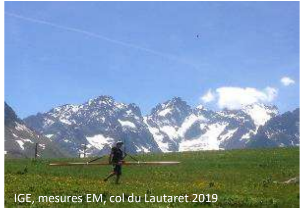
IGE, mesures EM, col du Lautaret 2019

GEOFCAN est un réseau de laboratoires de différents organismes de recherche et d'Universités, composé par le BRGM, l'INRA, l'INRAE, l'IRD, Sorbonne Université et l'Université Paris Sud-Orsay. Son objectif est de rassembler des compétences techniques et des connaissances pratiques et théoriques dans le domaine de la géophysique de sub-surface appliquée aux formations superficielles.